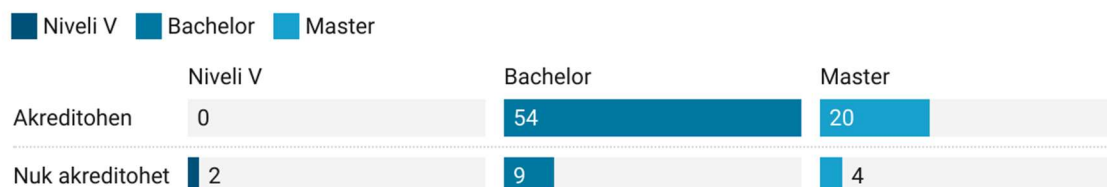
Figura 5: Vlerësimi i programeve të institucioneve private të arsimit të lartë varësisht nivelit të studimit

Siç shihet ne Figurën 5, pas vlerësimit nga ekspertët ndërkombëtarë dhe pas shqyrtimit të raporteve të vlerësimit nga KShC, nga 89 programe të vlerësuara 74 prej tyre u akredituan (0 të nivelit V, 54 të nivelit Bachelor dhe 20 të nivelit Master), kurse 15 programe nuk arritën t'i plotësojnë standardet e akreditimit (2 të nivelit V sipas Kornizës Kombëtare të Kualifikimit, 9 të nivelit Bachelor dhe 4 të nivelit Master).