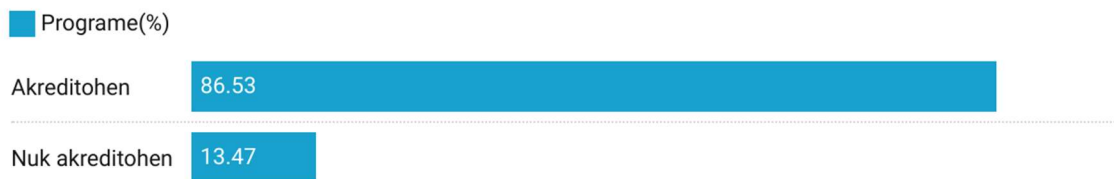
Figura 6: Vendimet e Këshilli Shtetëror të Cilësisë për 230 programet akademike

Siç shihet në Figurën 7, 86.53% e programeve janë akredituar suksesshëm, përderisa 13.47% nuk kanë kaluar pragun e akreditimit.