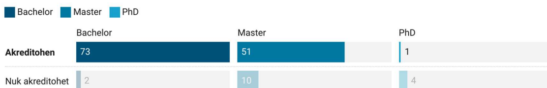
Figura 3: Vlerësimi i programeve të institucioneve publike të arsimit të lartë varësisht nivelit të studimit

Pas vlerësimit nga ekspertët ndërkombëtarë dhe pas shqyrtimit të raporteve të vlerësimit nga KShC, nga 141 programe të vlerësuara 125 prej tyre u akredituan (73 të nivelit Bachelor, 51 të nivelit Master dhe 1 program i nivelit të doktoratës), kurse 16 programe nuk arritën t'i plotësojnë standardet e akreditimit (2 të nivelit Bachelor, 10 të nivelit Master dhe 4 të nivelit të doktoratës). (Shih Figurën 3)