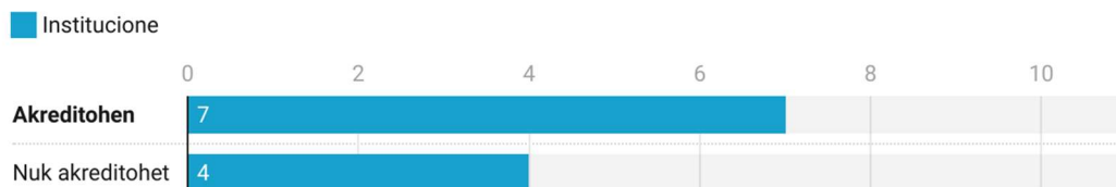
Figura 1: Vendime për akreditim të IAL-ve në nivelin institucional

Këshilli Shtetëror i Cilësisë (KShC) më 21.06.2021 mbajti mbledhjen e rregullt, në të cilën u analizuan dhe votuan raportet e ekspertëve ndërkombëtarë mbi vlerësimin e institucioneve të arsimit të lartë. Siç shihet në Figurën 1, nga gjithsej 11 institucione të vlerësuara, mbi bazën e rekomandimit të ekspertëve ndërkombëtarë, 7 (Shih Tabelën Nr. 3 dhe 4) nga këto institucione u ri-akredituan ndërsa 4 të tjera u refuzuan për ri-akreditim (Shih Figurën 2).