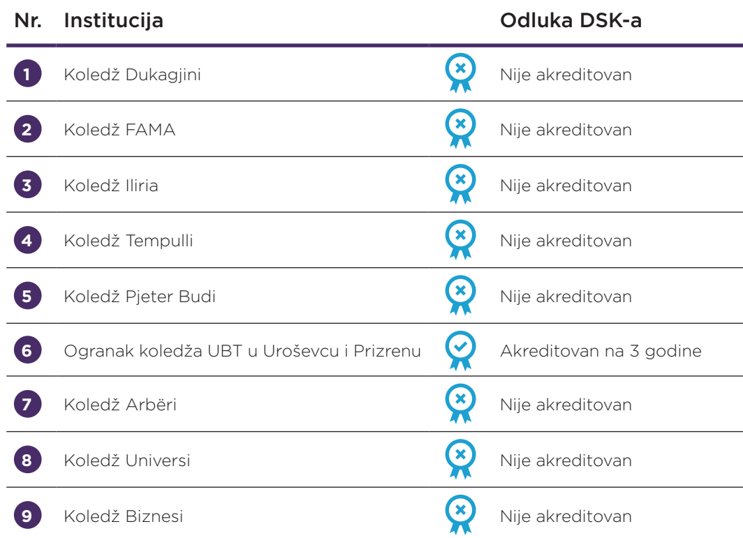
Tabela 2. Privatne institucije visokog obrazovanja koje su bile predmet procesa akreditacije tokom 2020. godine i odluke DSK-a

Od 9 privatnih koledža koji su bili predmet institucionalne akreditacije 2020. godine, samo su dve filijale UBT koledža bile akreditovane, jedna u Uroševcu, a druga u Prizrenu. Osam koledža nije bilo akreditovano na institucionalnom nivou.