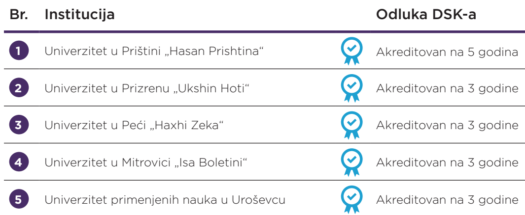
Tabela1. Javne institucije visokog obrazovanja koje su prošle institucionalnu akreditaciju 2020. godine i odluke DSK-a o njima

Od 5 ocenjenih javnih univerziteta, Univerzitet u Prištini „Hasan Prishtina“ je bio ponovo akreditovan na maksimalni period od 5 godina, dok su Univerzitet u Prizrenu „Ukshin Hoti“, Univerzitet u Peći „Haxhi Zeka“, Univerzitet u Mitrovici „Isa Boletini“ koje AKA nije akreditovala 2018. godine, sada su akreditovani na period od 3 godine. Univerzitet primenjenih nauka u Uroševcu je akreditovan na period od 3 godine.